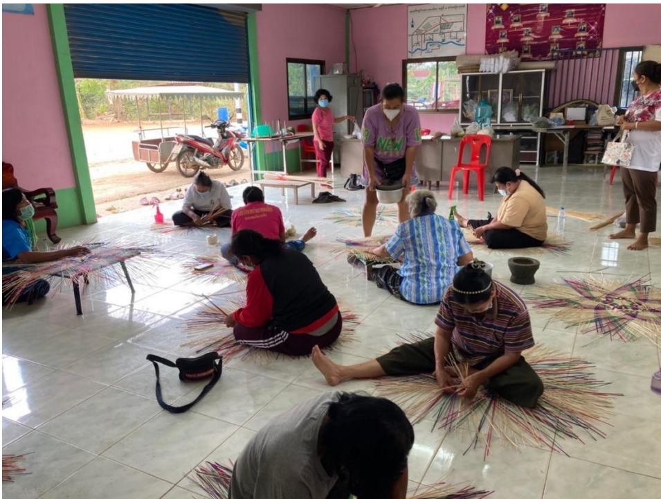
ลงมือปฏิบัติสานฝาชีจากไม้ไผ่