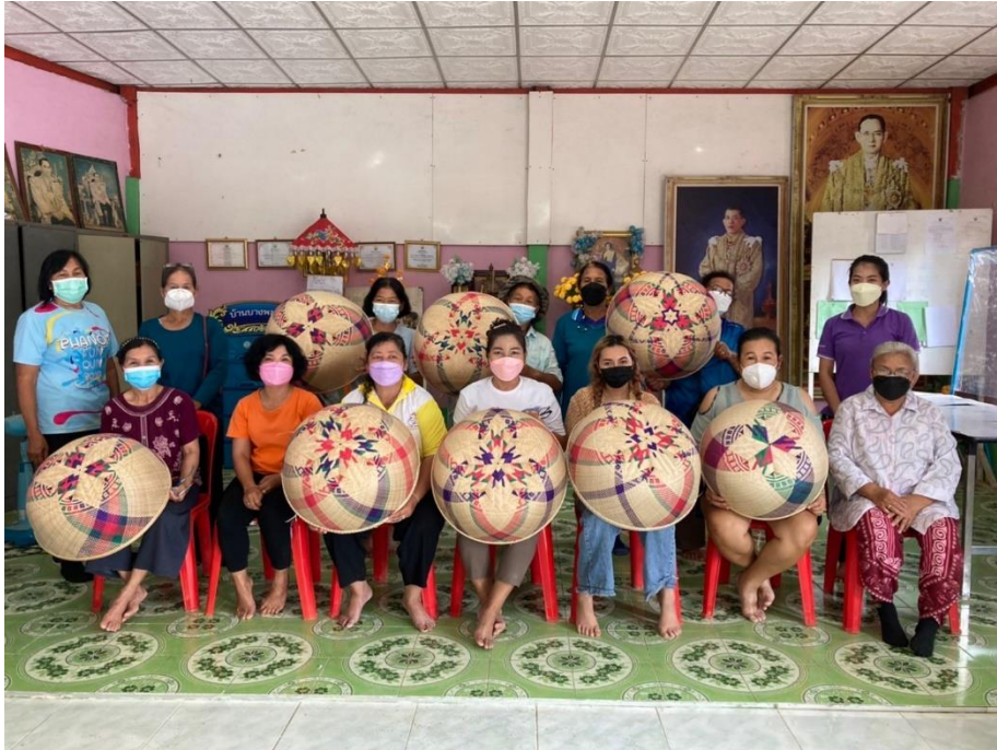
ถ่ายภาพพร้อมกับผู้เรียนและวิทยากร

ณ ศาลาอเนกประสงค์บ้านบางพะเนียง ตำบลคูยายหมี อำเภอสนามชัยเขต จังหวัดฉะเชิงเทรา