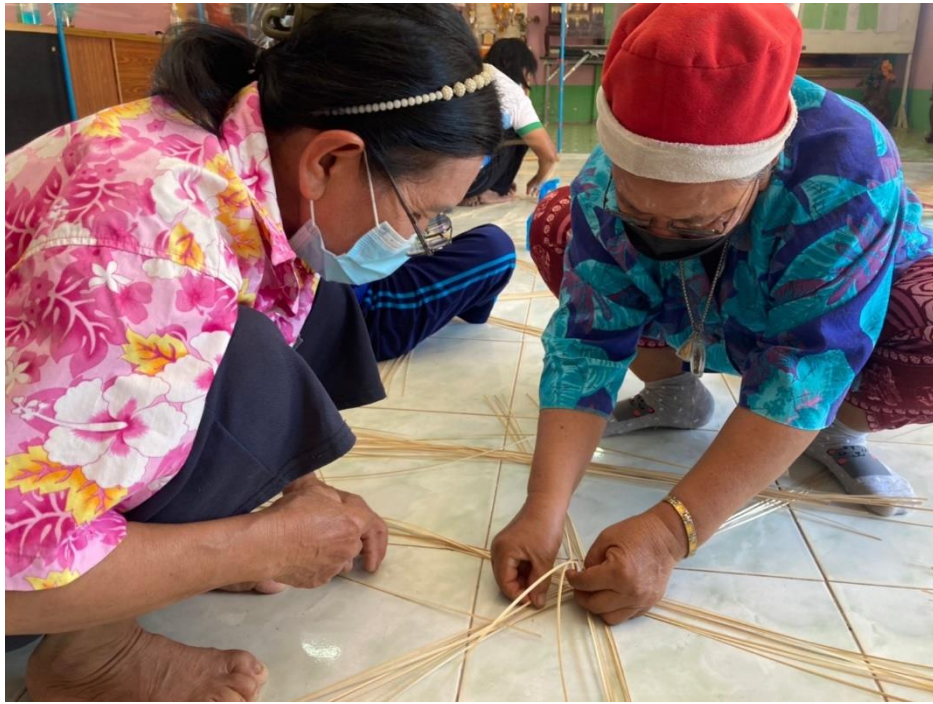
ลงมือปฏิบัติสานฝาชีจากไม้ไผ่

ณ ศาลาอเนกประสงค์บ้านบางพะเนียง ตำบลคูยายหมี อำเภอสนามชัยเขต จังหวัดฉะเชิงเทรา