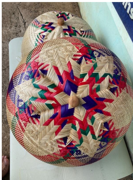
ผลงานของผู้เรียนสานฝาชีไม้ไผ่