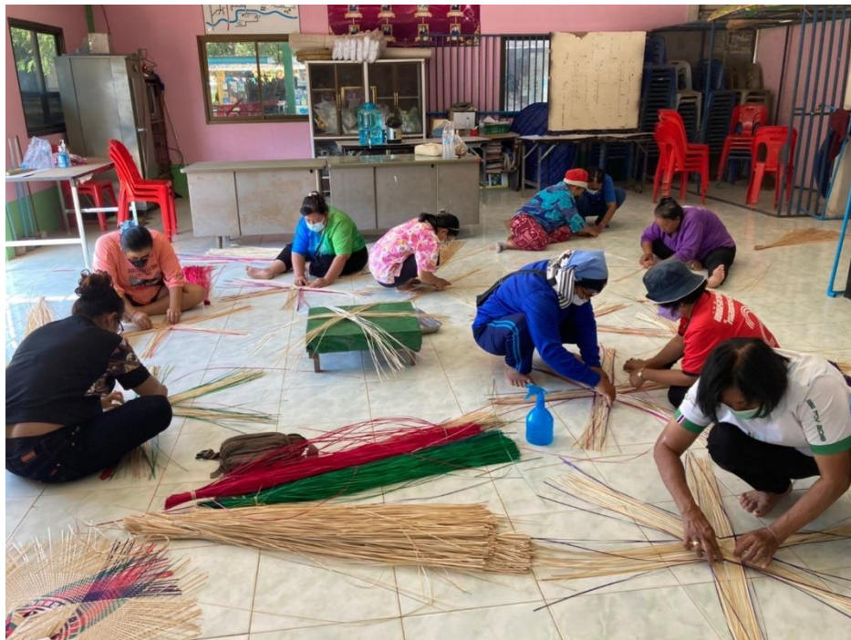
ลงมือปฏิบัติสานฝาชีจากไม้ไผ่