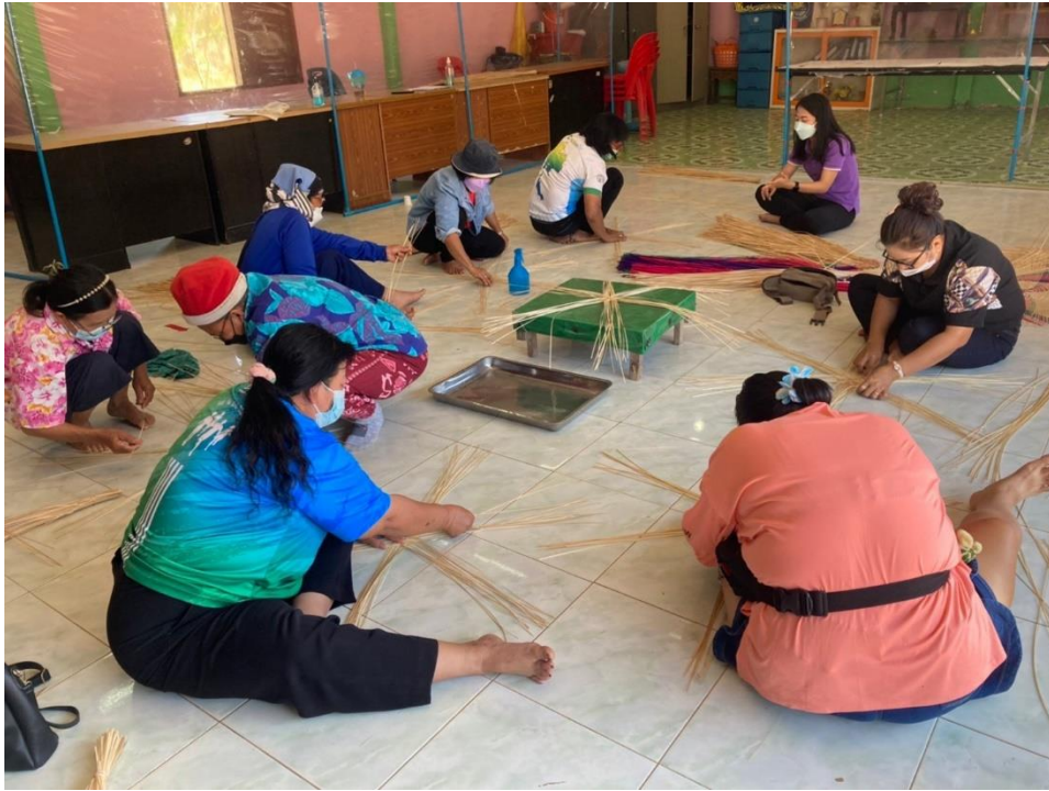
ลงมือปฏิบัติสานฝาชีจากไม้ไผ่

ณ ศาลาอเนกประสงค์บ้านบางพะเนียง ตำบลคูยายหมี อำเภอสนามชัยเขต จังหวัดฉะเชิงเทรา